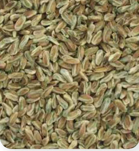
BOZ İÇ (SIFIR)