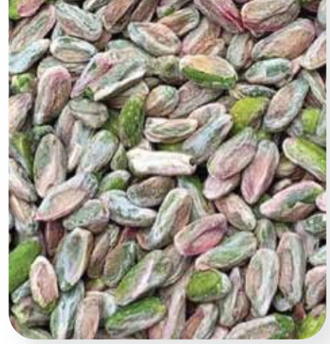
BOZ İÇ (BOZ 2)