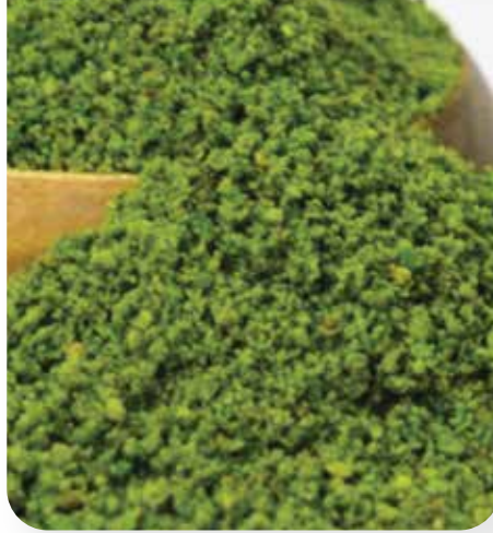
BOZ TOZ (SIFIR)