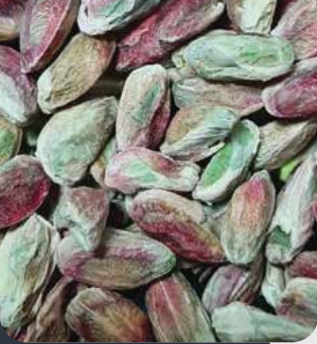
BOZ İÇ (BOZ 3)