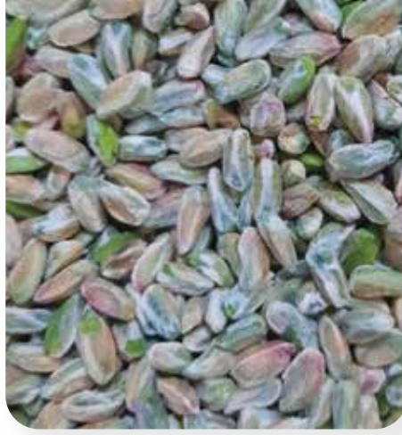
BOZ İÇ (BOZ 1)